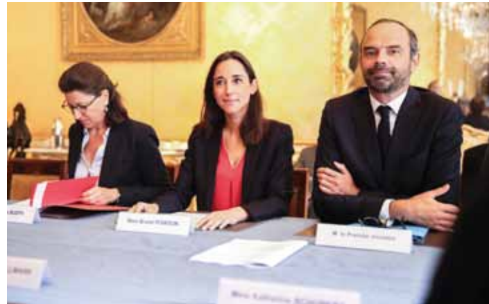
Remise du rapport sur le Ceta au Premier ministre, Édouard Philippe, le 8 septembre 2017 à Matignon.

LIBRE-ÉCHANGE En juillet le gouvernement a lancé une commission d'évaluation de l'impact du Ceta sur l'environnement, le climat et la santé... Dont il choisit d'ignorer les conclusions aujourd'hui.