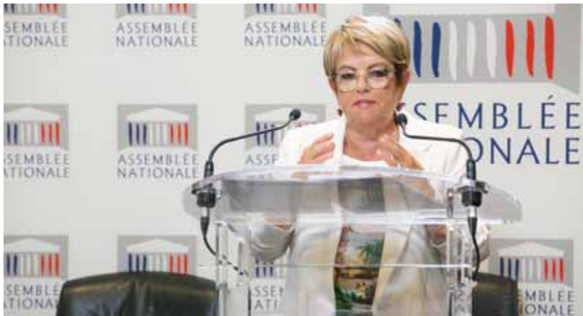
Monique Iborra, députée, rapporteure de la mission parlementaire sur les Ehpad, présentant les constats de cette mission « flash » à la presse, le 13 septembre 2017.