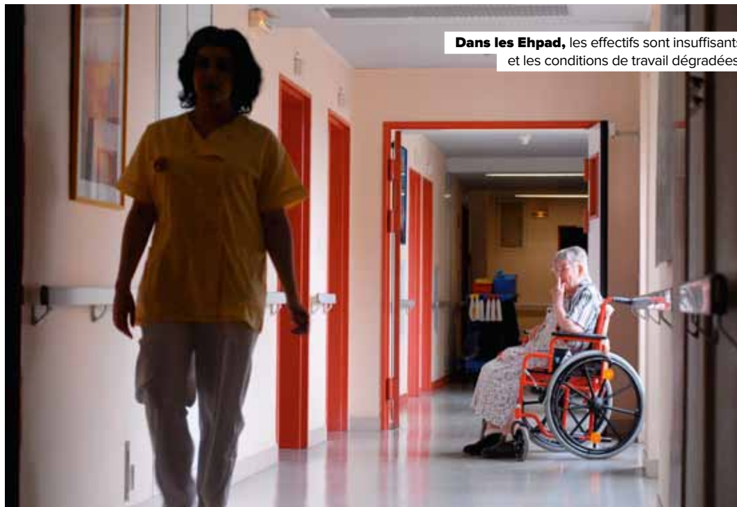
Dans les Ehpad, les effectifs sont insuffisants et les conditions de travail dégradées.

REVENDEICATION FO, qui redoute 2000 à 3000 suppressions de postes, en réclame l'abandon et demande à être reçue au ministère de la Santé.