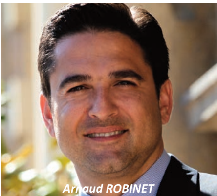
Arnaud ROBINET Député Maire de la Ville de Reims

Je ne dirais pas la vérité si je disais que je partageais tous les combats de Force Ouvrière, mais nous avons des convictions communes, surtout depuis les attentats de novembre.