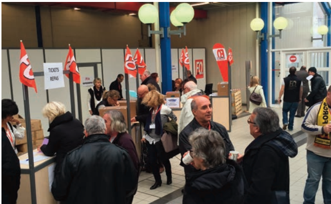
Les banques de l'accueil

Alors, que la fête soit belle et que Force Ouvrière sorte renforcée de cette semaine de travail !