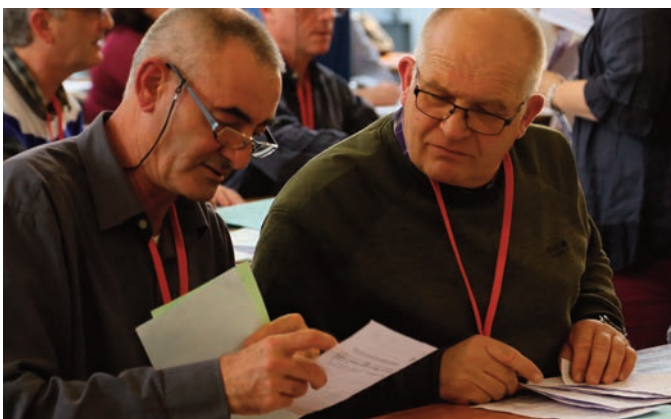
La commission de vérification des mandats